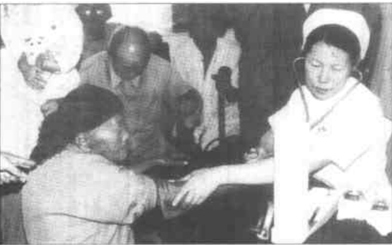
“八一”建军节来临之际，市民政局组织荣军医院的医护人员到挂职联系的河口区义和镇，为“三老”优抚对象进行义诊，并赠送了部分药品和保健用品。

里建起了蔬菜加工厂，解决了群众销售难的问题，实现了农企双赢。该村群众把耕地全部种上了胡萝卜，在政府的引导下，全镇一年时间新发展胡萝卜种植面积一万多亩。 (李连起 蒋涛)