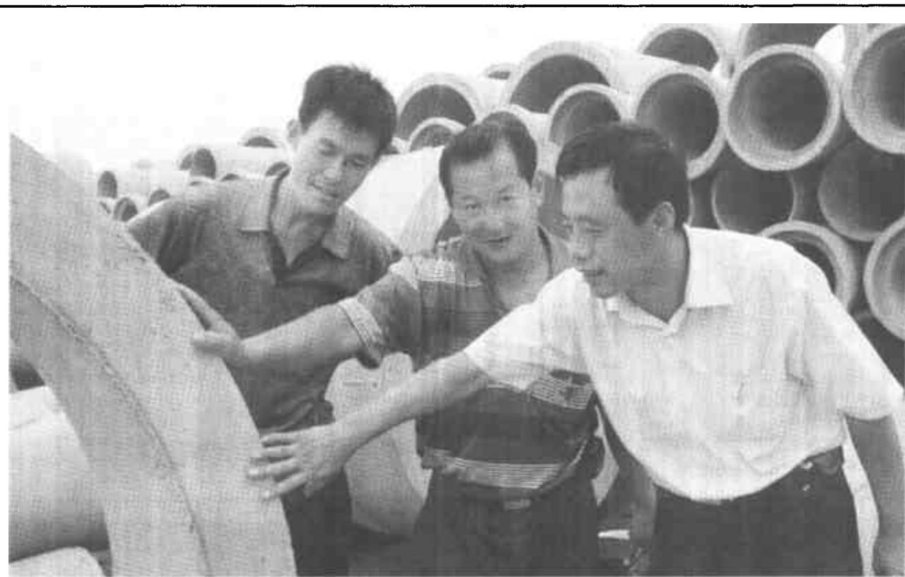
东营区史口农村信用社把扶持民营经济发展作为一项重要工作。在该社投入120万元信贷资金的扶持下，东营顺源建材有限公司这个以生产水泥制品为主的私营企业，在激烈的市场竞争中牢牢站稳脚跟，仅今年上半年，就实现产值190万元，创造利润57万元。

构建工业园区的同时，集中财力抓好城镇基础设施建设，先后完成了供水、供暖、道路等多项重点工程建设。目前在镇区内形成了“四横八纵”的道路基础框架，极大地便利了交通；道路硬化率100%，自来水受益人口2万多人，绿化覆盖率30%。自1999年以来小城镇建设实行综合开发，2003年综合开发了镇住宅区五栋住宅楼及商贸楼、中学教学楼、中学餐厅、小别墅等工程，总投资4000多万元、建筑面积52800平方米，目前全部投入使用。全镇综合开发率达到了80%。对城镇周围的工农、海北、海中重点规划，重点建设，改变了农村生活、居住环境脏、乱、差的局面，逐步建立了布局合理的新型村庄，推动了城乡一体化进程。 (刘宪亮 张金宗 王安峰)