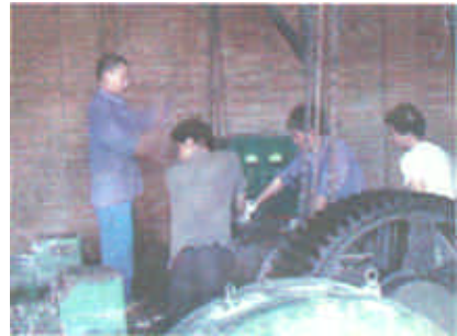
部分企业已按要求开始拆除设备。

据介绍,自去年以来,我市境内相继出现了一批土(小)污染企业,主要包括小造纸、小电镀、小铸造和小化工。这些企业没有任何治污措施,生产设备落后,污