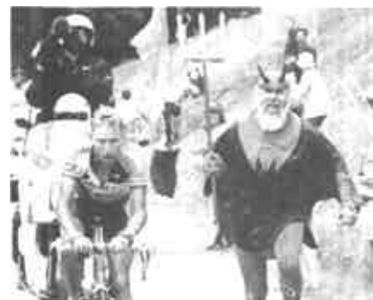
直到上世纪70年代，摄像记者才坐着摩托车一路“跟踪”车手。

每位车手身上都携带着小型录音机，他们可以紧随其后的车队指导交谈。车队指导通常会留意安装在每个车队汽车上的电视，而电视台也能够了解到重要信息，并随时对画面进行切换报道，因此观众也能够对比赛了如指掌。既然车手身上有小型录音机，他们也可以像观众一样知道比赛的情况。