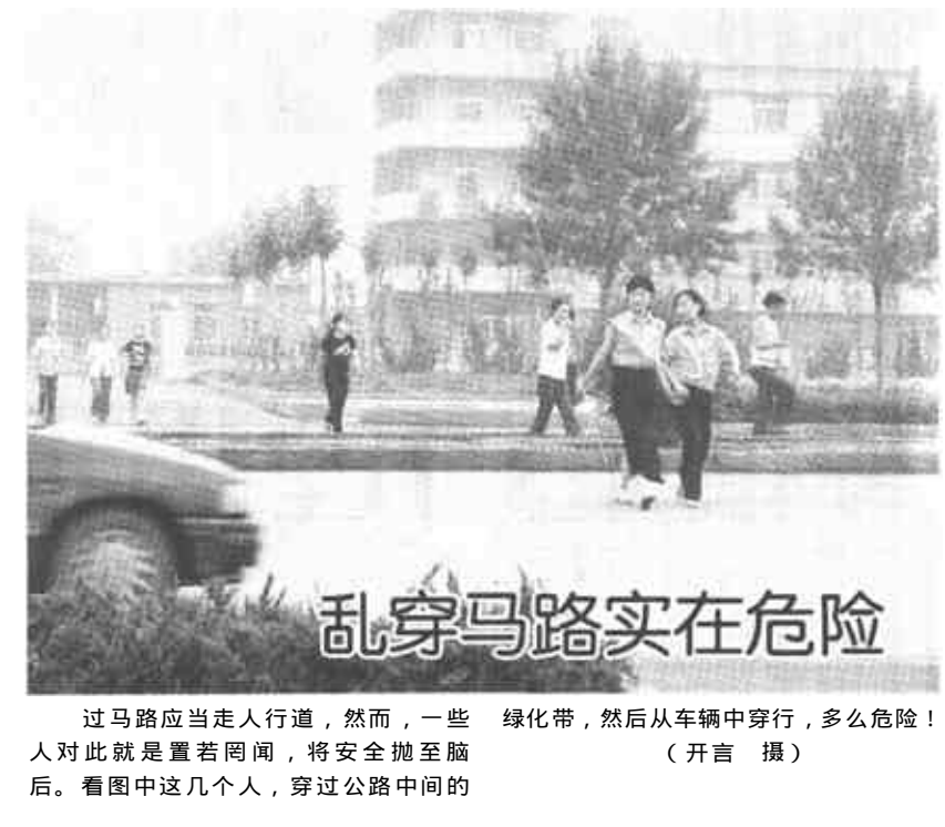
过马路应当走人行道，然而，一些人对此就是置若罔闻，将安全抛至脑后。看图中这几个人，穿过公路中间的绿化带，然后从车辆中穿行，多么危险！

至此，一起沉寂近两年之久的交通肇事逃逸案终于宣告告捷。目前，韩某已被东营东城公安分局依法刑事拘留，此案正在进一步审理中。（记者 董冬梅 通讯员 李光辉）