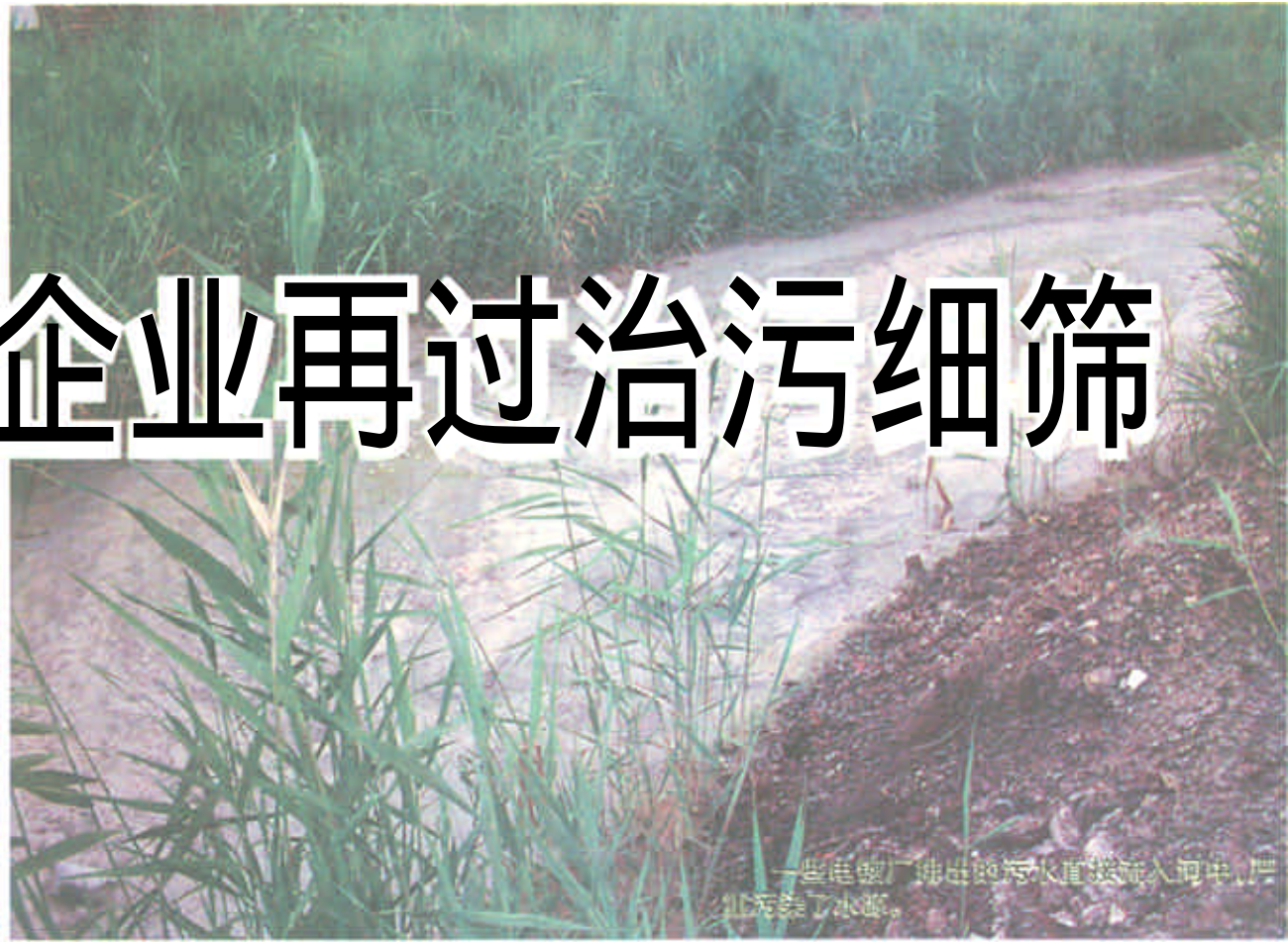
一些电镀厂排出的污水直接流入河中,污染了水源。

对在册的43家企业,督查人员都逐个进行了细致的检查,不仅严肃指出了他们存在的问题,向他们讲明了本次专项整治的期限和意义,还积极为他们想办法,帮助他们在规定时限内完成拆除工作。在检查中还发现,各县区政府对此高度重视,不仅下发了相关文件,还积极行动起来,提前着手,并多次进行广泛的调查摸