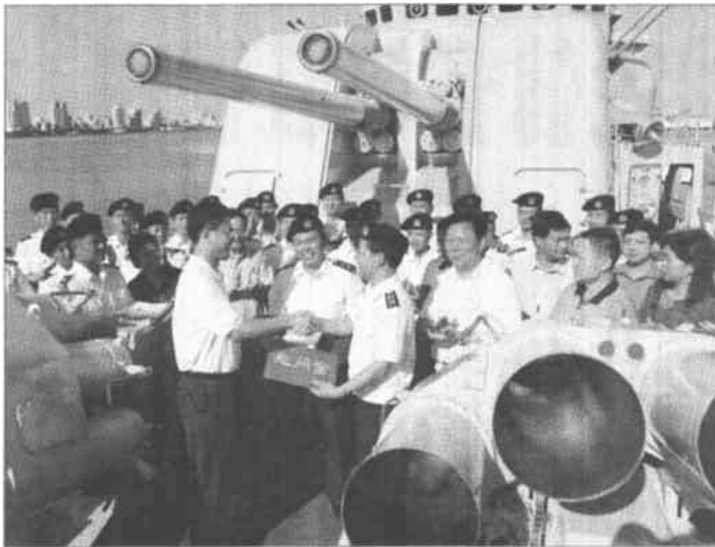
在“八一”建军节到来之际，广东省江门市组成拥军慰问团，冒着高温来到海军南海舰队某部“江门”舰，代表江门市人民亲切看望了全舰官兵，并向“江门”舰官兵送去了慰问品和慰问金。